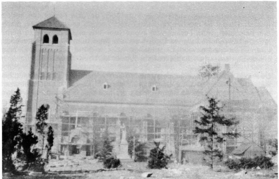
Winter 1949 - Het dak zit er op. Aan het torentje van de Angelusklok wordt nog wel gewerkt.