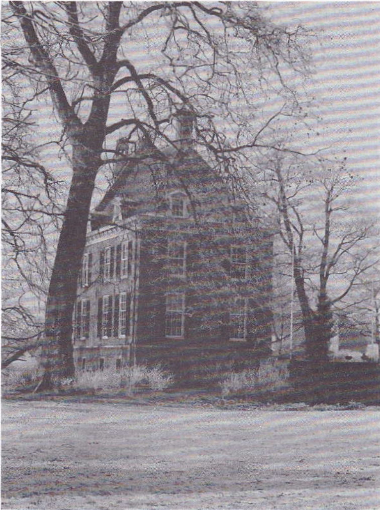
"De Kinkelenburg" in de winter.

Na de 18 e -eeuw is het gebouw langzaam in verval geraakt. In de Tweede Wereldoorlog is het opnieuw beschadigd. Onder leiding van architect Ch. Estourgie kwam in 1954 de restauratie gereed en kreeg "De Kinkelenburg" het uiterlijk dat ons zo vertrouwd is.