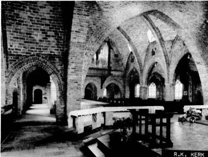
Het interieur van de kerk. Het orgel is in het midden nog net zichtbaar.